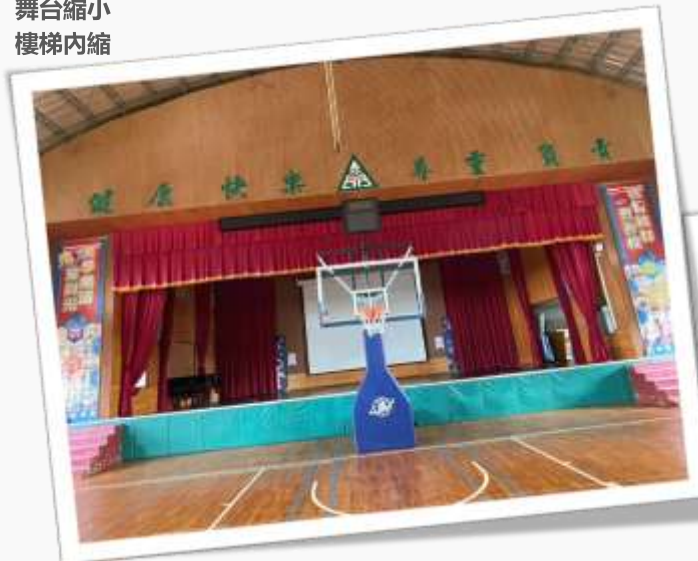
舞台縮小 樓梯內縮