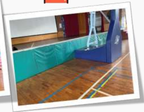
籃球架退縮 保障防撞空間