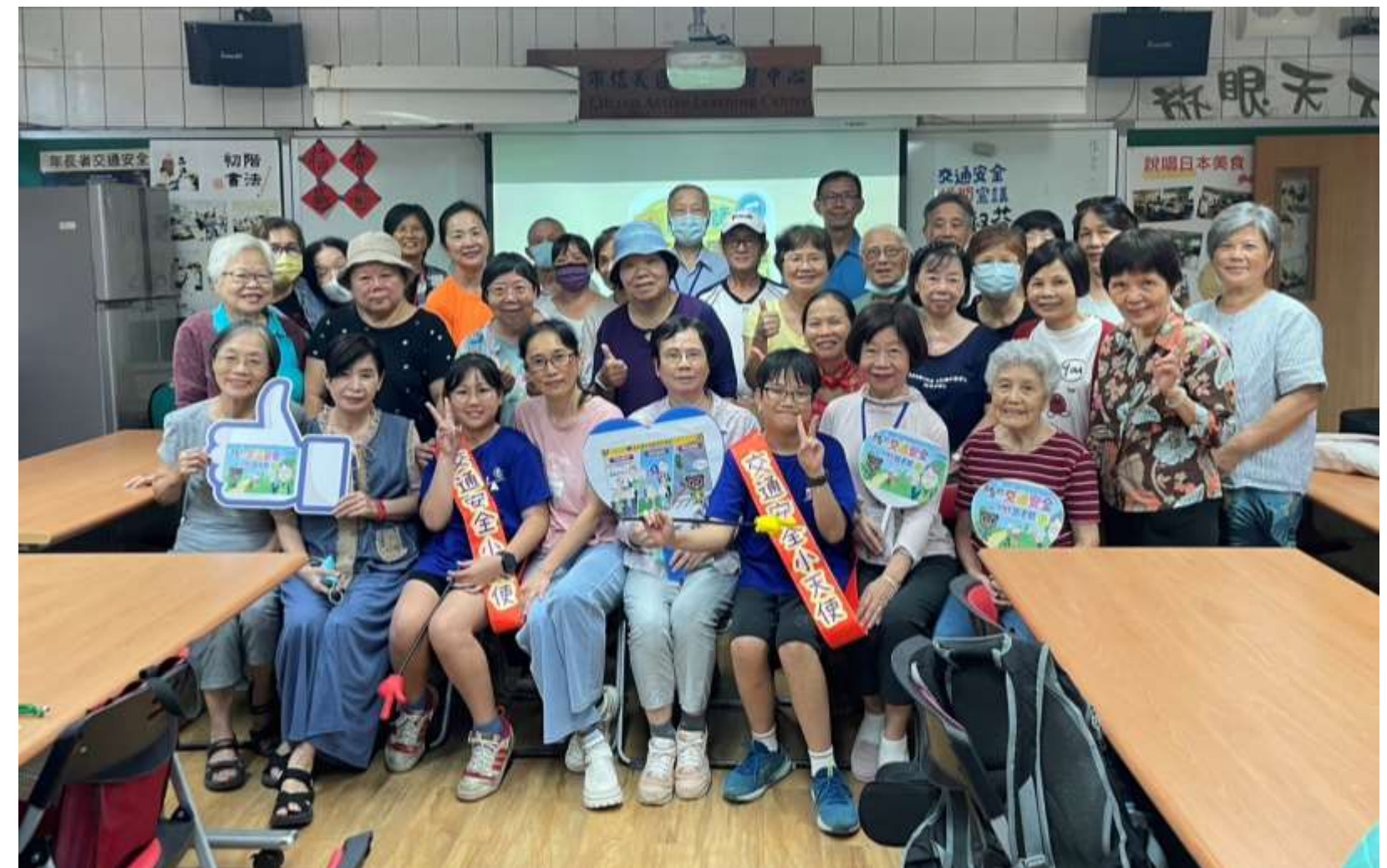
▲交通安全代間教育