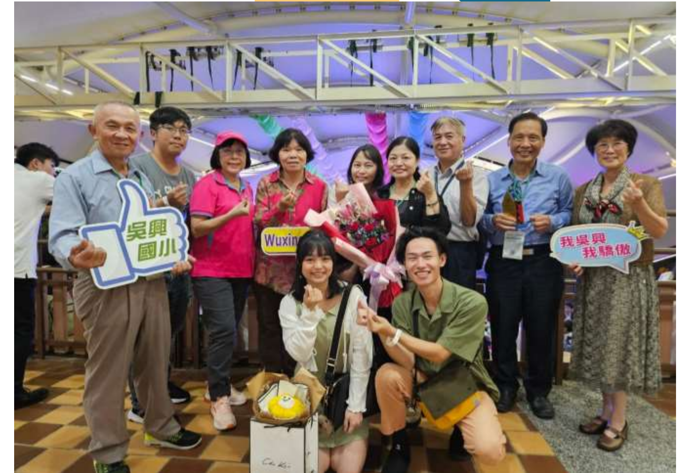
▲臺北市 113 年度 樂齡同樂夜暨終身學習 頒獎典禮