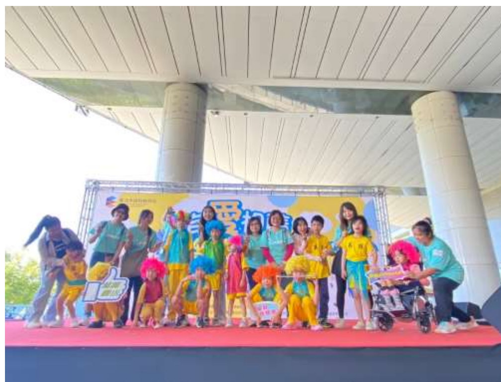
113年北市特教育樂活動