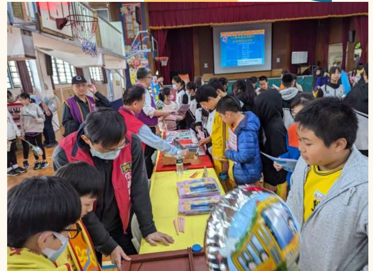
六年級升學博覽會