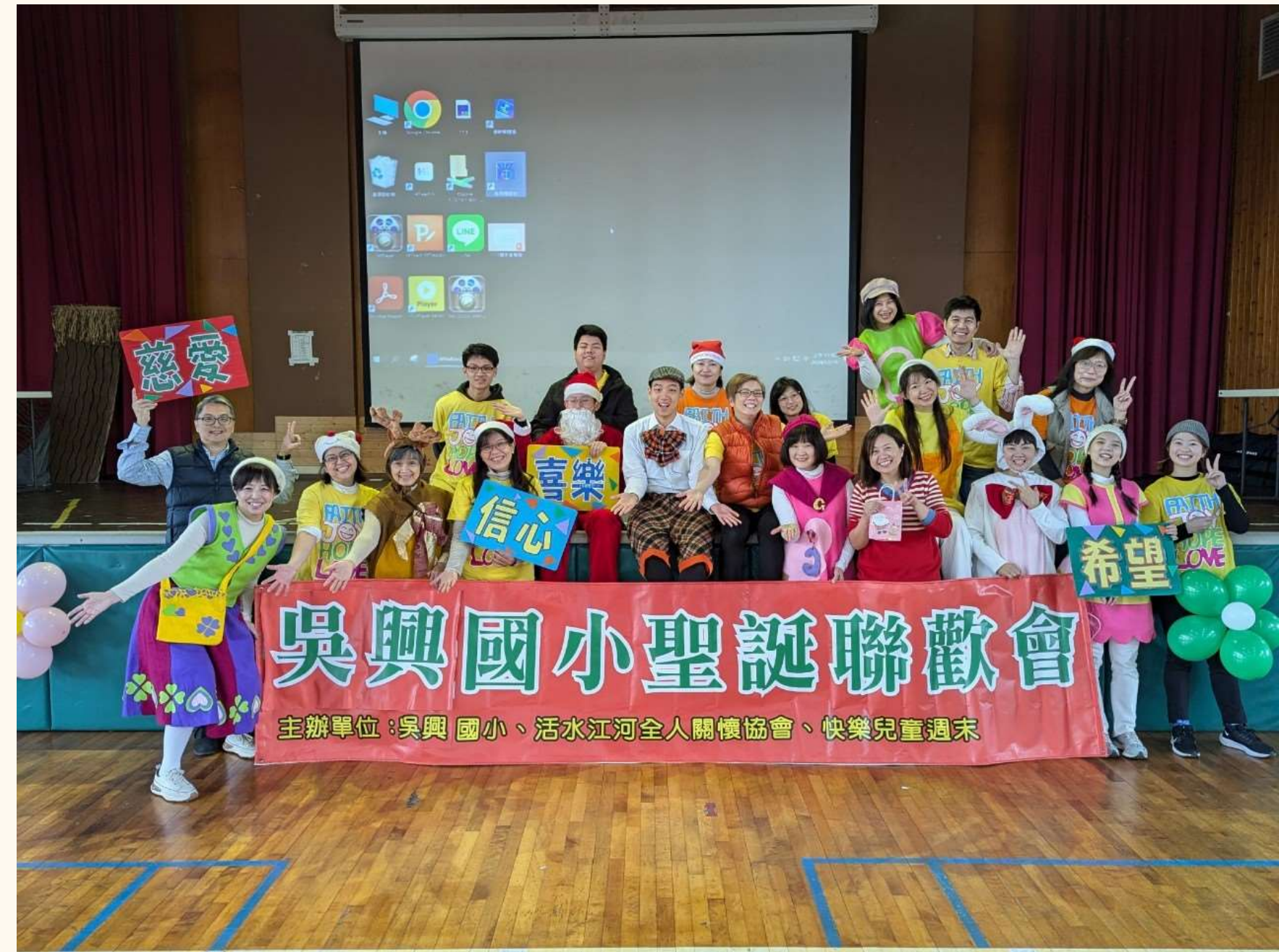
聖誕音樂劇欣賞活動