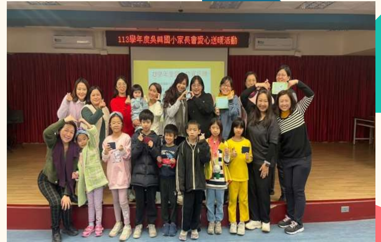
家長會愛心物資捐贈