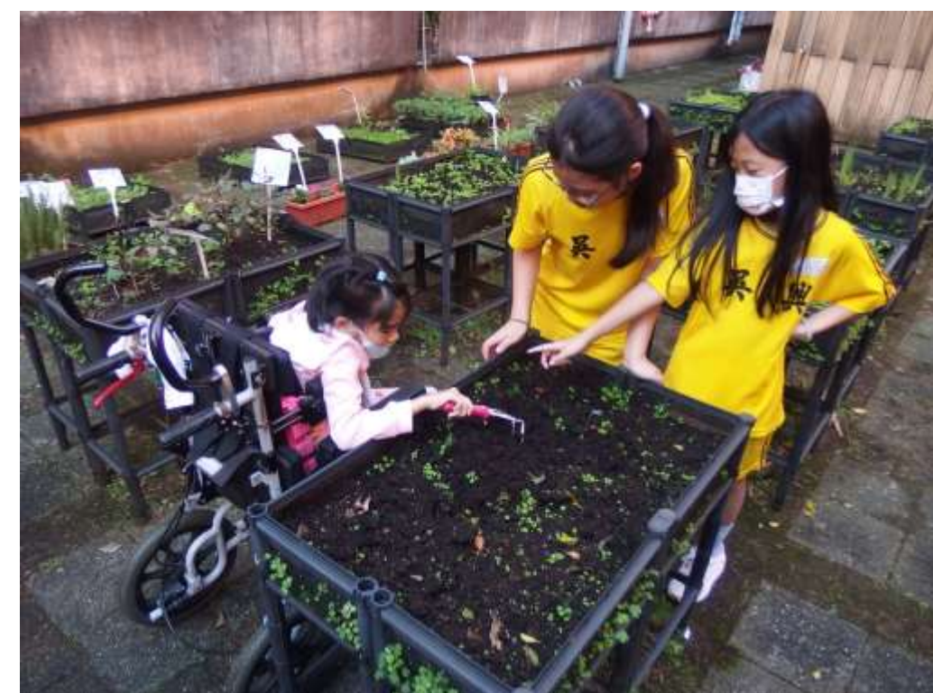
普特融合-特教小精靈