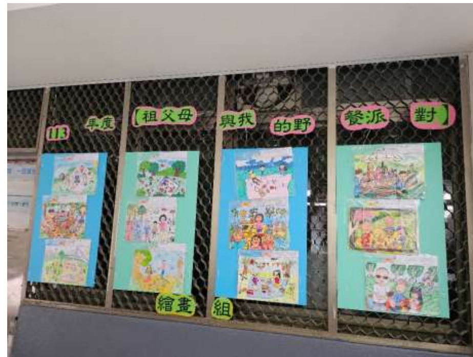
慶祝113年度祖父母節