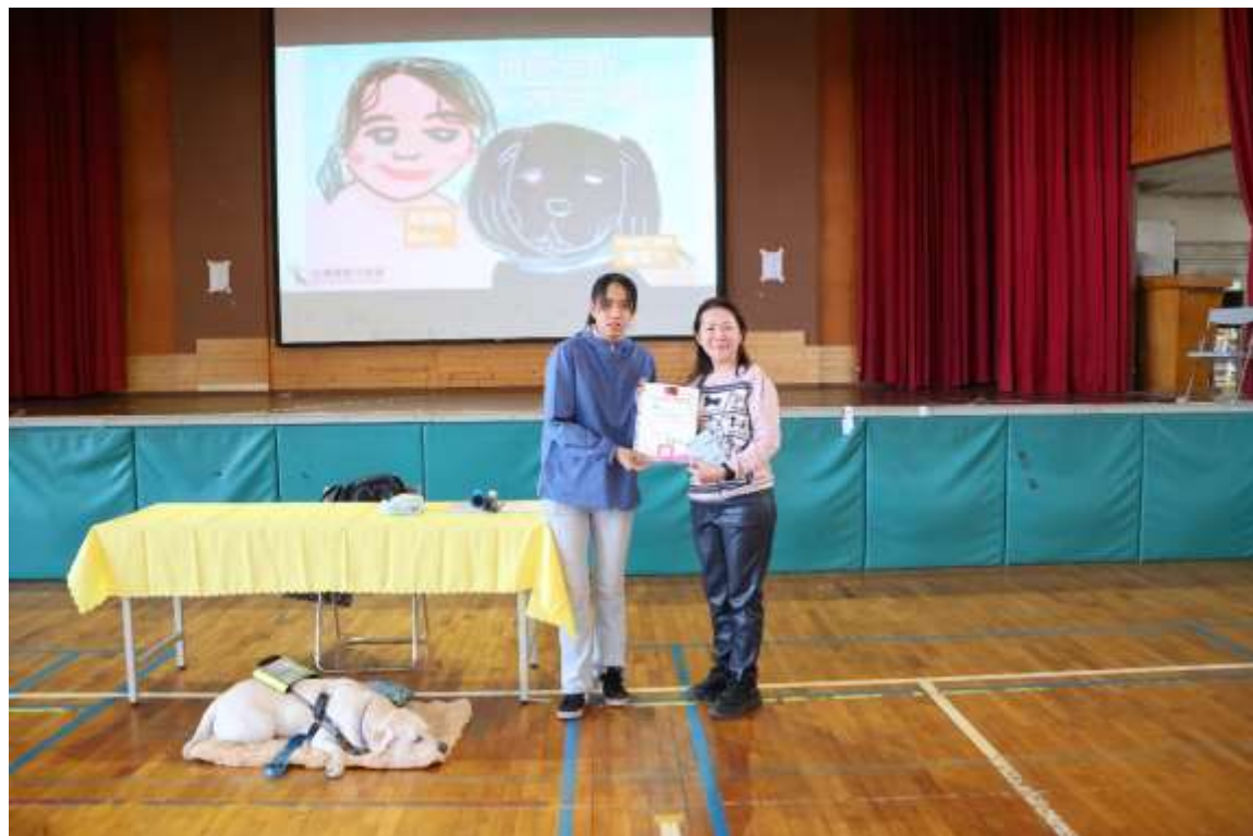
認識視障&導盲犬宣導