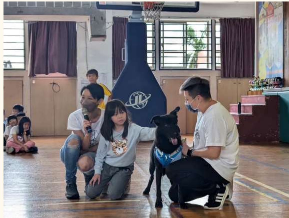
三年級動物保育宣導