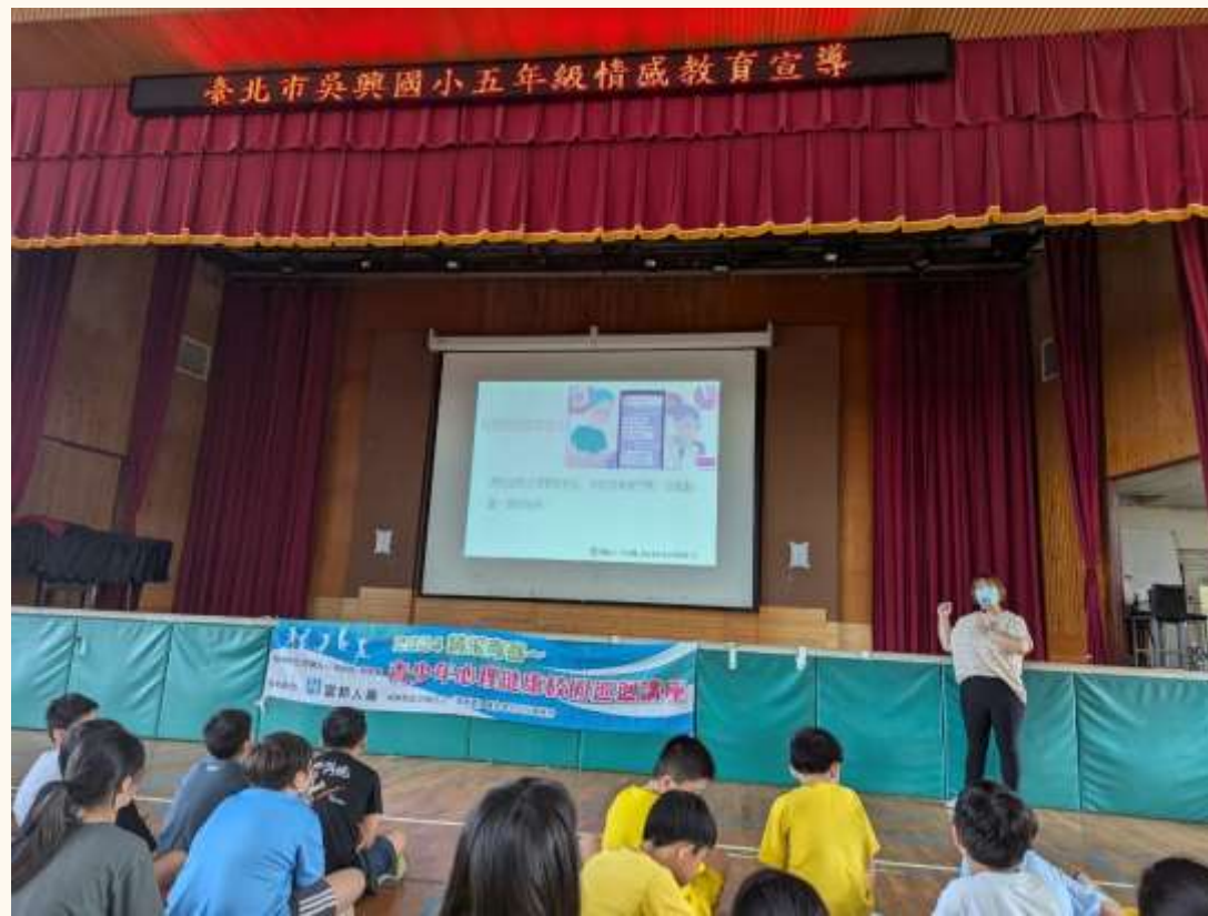
五年級情感教育宣導