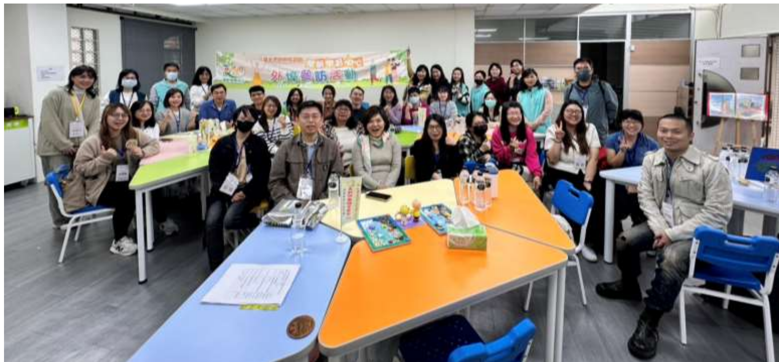
◀臺北市 113 年度樂齡 中心外埠參訪活動