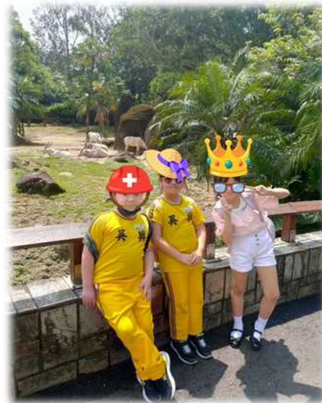
復學後與朋友去動物園