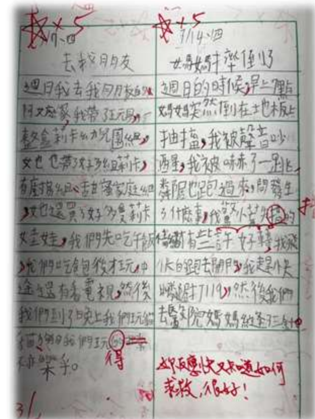
丹丹學會寫作文了