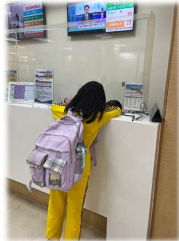
丹丹去看生病的媽媽