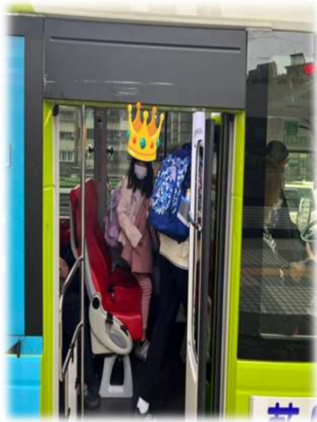
丹丹學會獨立搭公車上下學